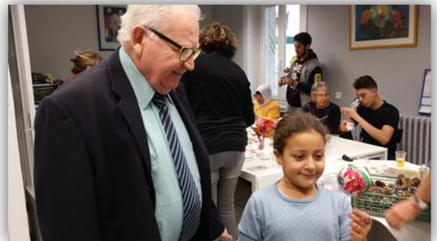
Atelier déco du repas solidaire de Noël avec d'autres bénévoles de l'Amicale de tous les âges