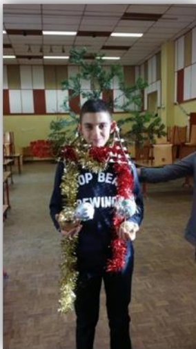
Préparation de la salle du repas solidaire de Noël