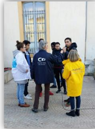
Téléthon de Roanne