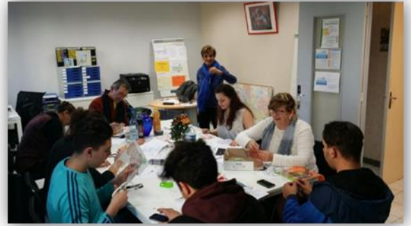
Atelier décoration du repas solidaire de Noël