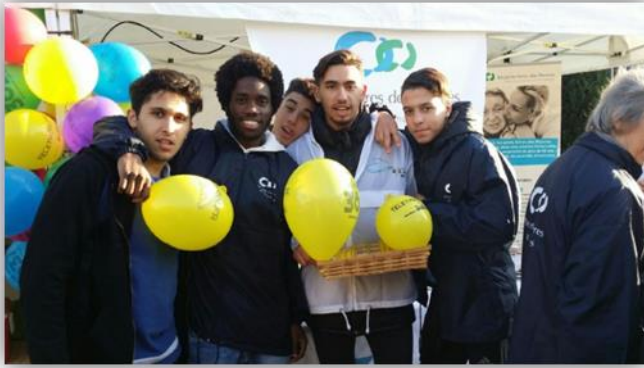
Téléthon de Roanne