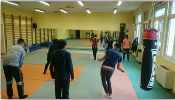
Préparation du spectacle du repas solidaire de Noël