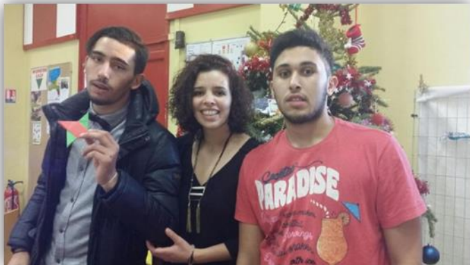
Repas solidaire de Noël, préparatifs de la salle