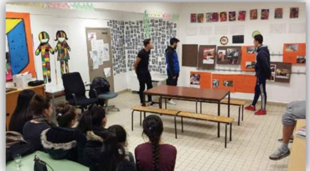
Présentation du projet pour recruter des jeunes bénévoles