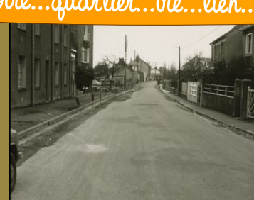
Rue des Bourderies dans les années 60