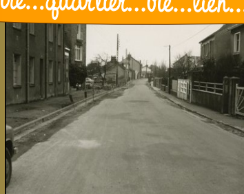
Rue des Bourderies dans les années 60