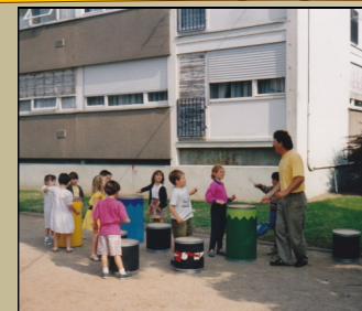
Animation de quartier années 90