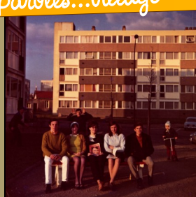
Jeunes des Bourderies années 70