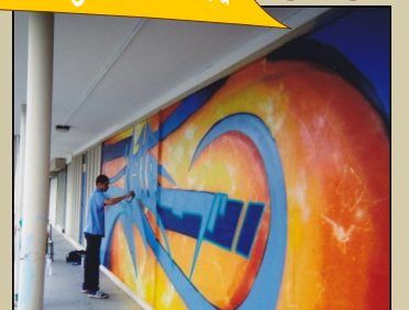
Art mural rue de Saint Brévin