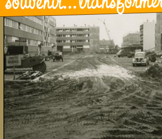
Impasse Gadebois dans les années 60