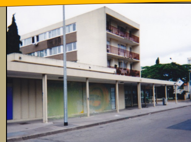
Rue de Saint Brévin