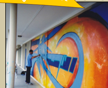
Art mural rue de Saint Brévin