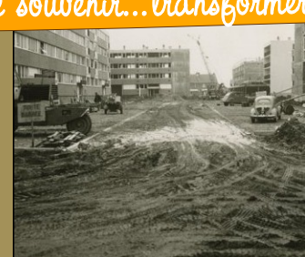
Impasse Gadebois dans les années 60