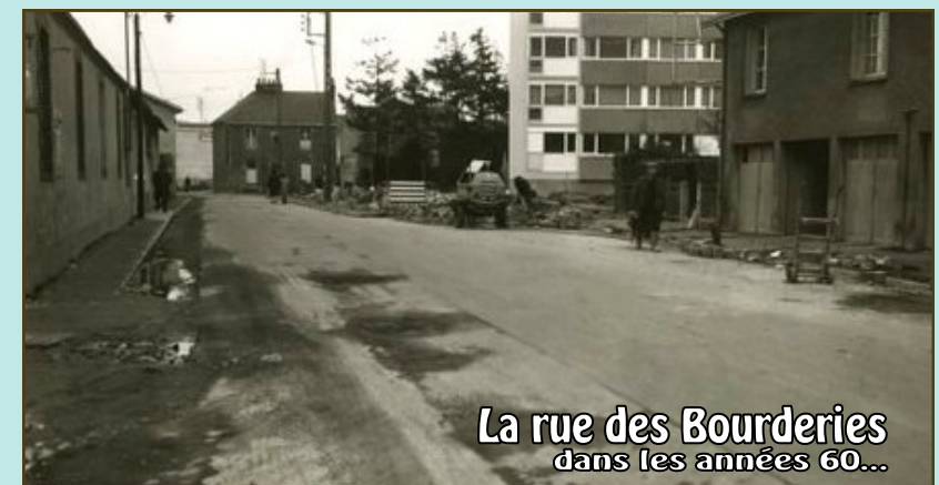
La rue des Bourderies dans les années 60...

un terrain triangulaire qui est aujourd'hui occupé par une superette (Netto). L'idée était de permettre aux ouvriers de profiter du bon air du coteau. Au fil des années, des maisons d'habitation et de petits entrepôts se sont construits, gagnant progressivement sur les terres agricoles, dans les années 30. Cependant le jardinage prend le pas sur les prés et les terres à labour. Il renvoie alors autant à la production de légumes pour les conserveries qui étaient dans le bas de Chantenay, qu'au travail de