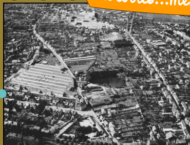
Vue aérienne des Bourderies 1958

récit...lien...traces...histoires...mémoire...quartier...vie...lien...se souvenir...transformation