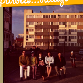
Jeunes des Bourderies années 70