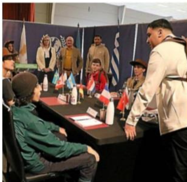
Un escape Game très axé sur le sauvetage de la planète

► Correspondant Midi Libre : 06 20 06 43 47