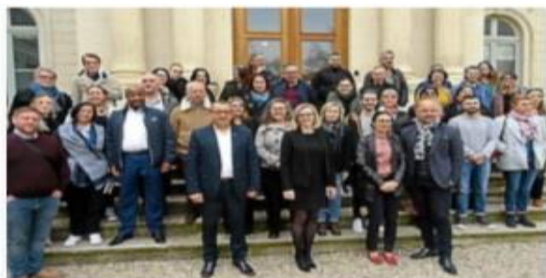
Les associations des quartiers Est ont largement répondu présent.