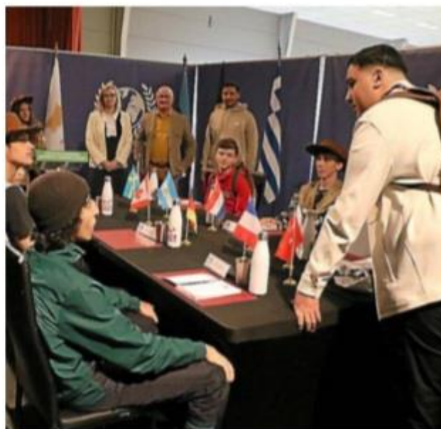
Un escape Game très axé sur le sauvetage de la planète

► Correspondant Midi Libre : 06 20 06 43 47