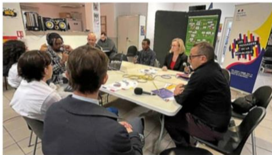
L'atelier radio a permis aux jeunes d'échanger sur les apprentissages du jour.