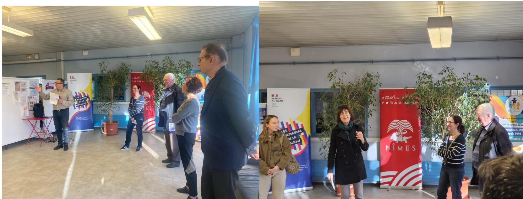
La Galette de la Fraternité – 08/01/2024