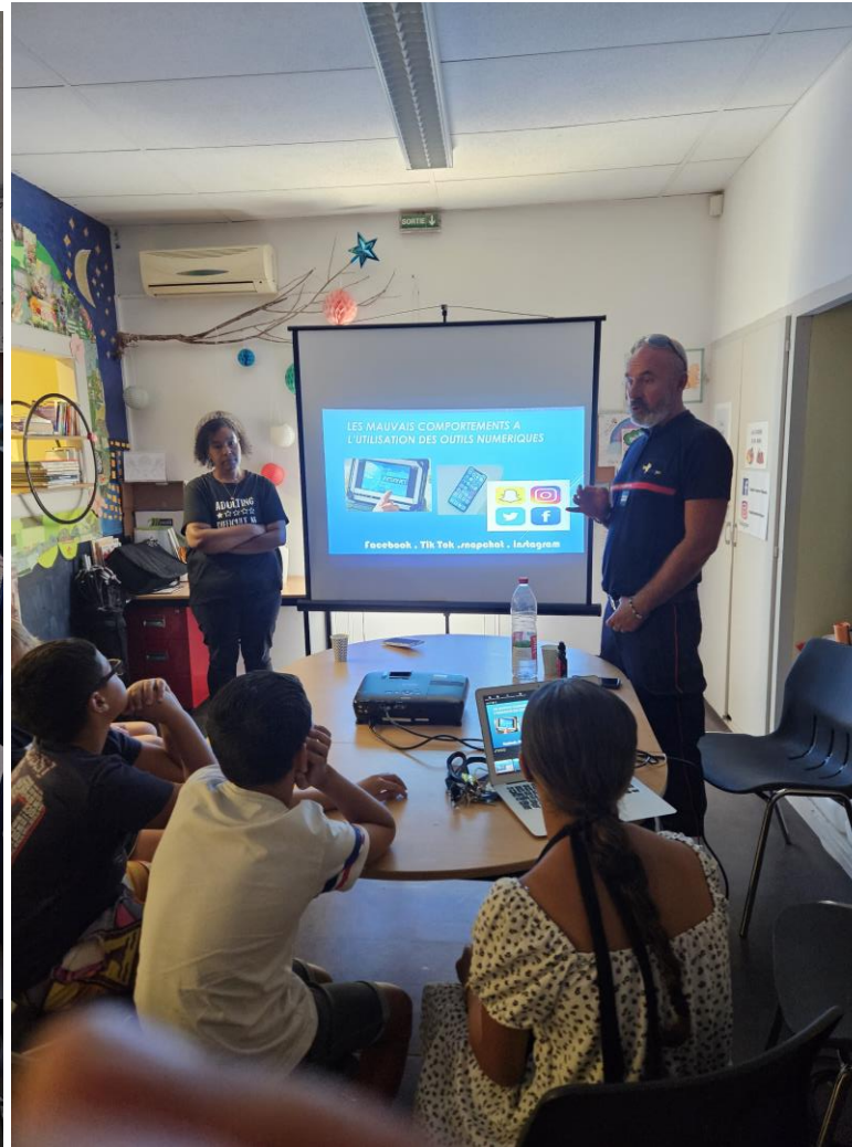
CS L'ODYSEE à Redessan – 08/08/2023