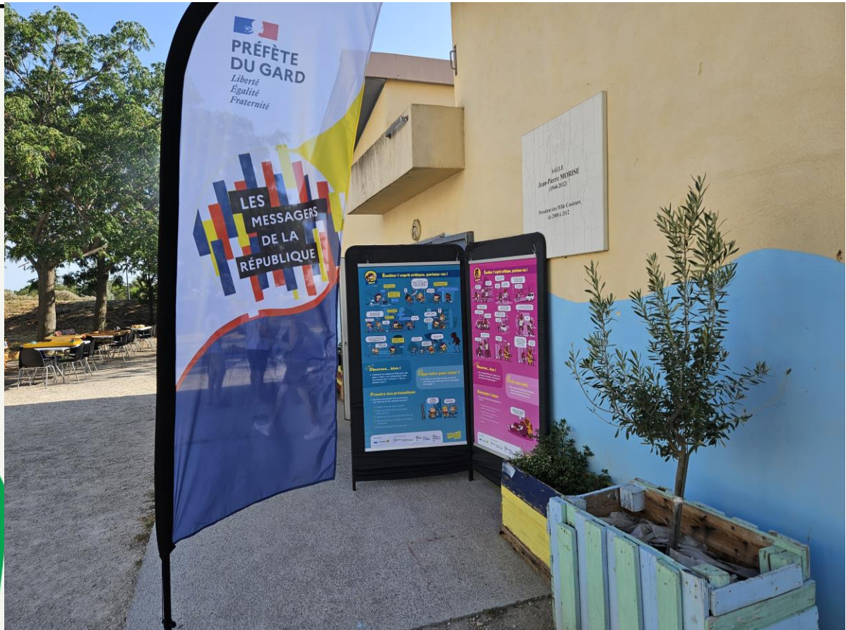
LES VENDREDIS DE LMC – 21/07/2023