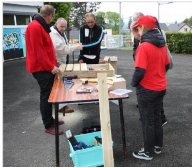
Parmi les activités proposées, on pouvait apprendre à fabriquer un fauteuil de jardin.

Le nombre de personnes à avoir participé à cette journée.