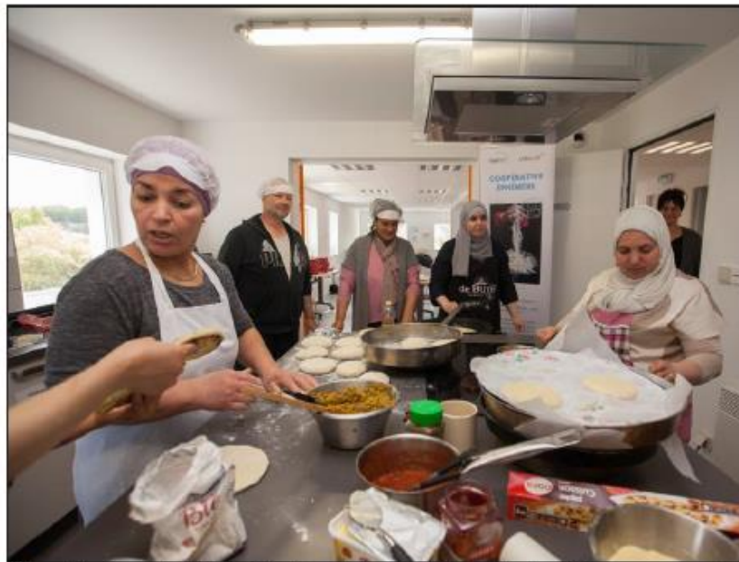
Elles cuisinent pour le plaisir de faire découvrir leur savoir-faire culinaire et dégager un revenu. Les commandes peuvent être passées au 07 69 92 34 17.

Elles ont quitté l'intimité de leurs cuisines pour se mettre aux fourneaux de la Passerelle, un espace citoyen niché sur les hauteurs de Champvalon. Ensemble, elles imaginent les plats, font leurs courses, cuisinent le matin et vendent l'après-midi le pain farci à la viande hachée et aux poivrons, pizzas turques, soupe aux lentilles, pâtisseries orientales, paella et on en passe, des dorées, colorées, épicées, savoureuses... Elles, ce sont treize femmes issues des différents quartiers de l'agglomération âgées de 30 à 50 ans, pour la majorité sans emploi, toutes désireuses d'entreprendre. « Montrer de quoi nous sommes capables quand on se colle aux fourneaux. No-