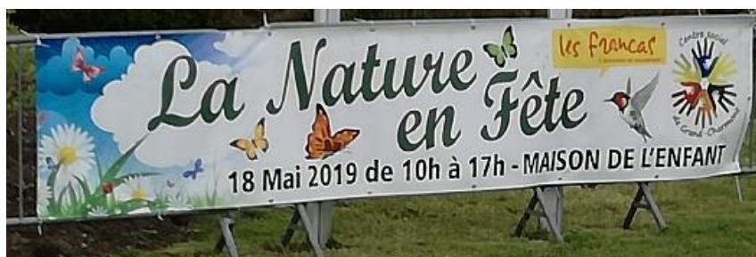
Bannière offerte par la municipalité.

Une très belle journée remplie de partages, d'échanges et de découvertes entre familles et les différents partenaires ( Les bénévoles, Frat'air, l'Adapei, la ville, les marcheurs... et tout ceux que je n'ai pas cités) juste un grand merci pour toutes ces personnes qui nous motivent chaque jour à aller de l'avant. « L'union fait la force »