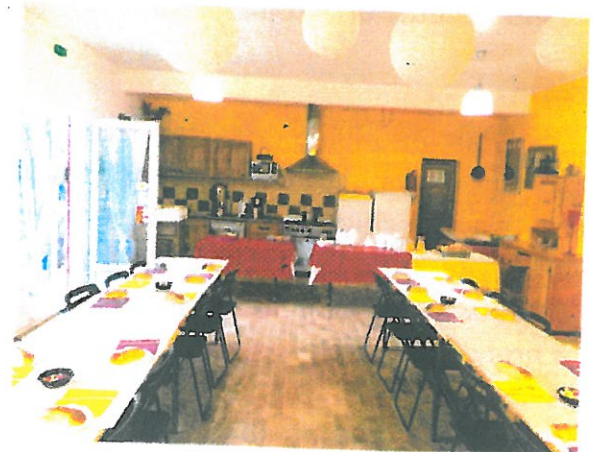
Salle de restauration