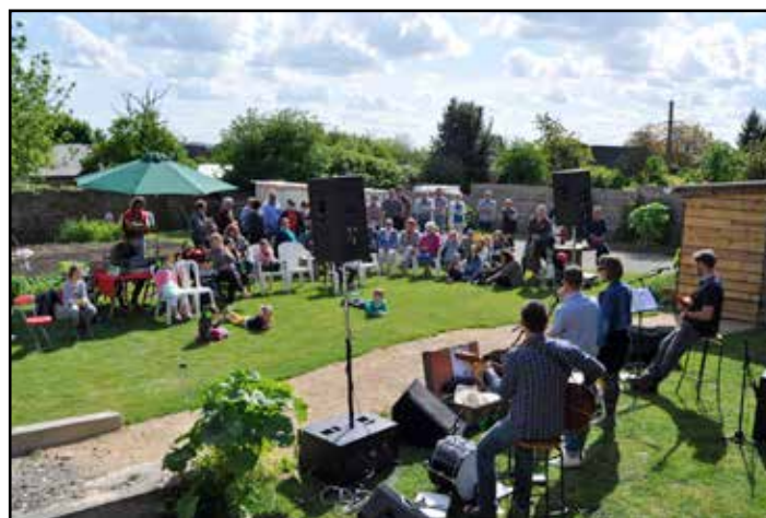
Musique au Jardin avec le groupe «Les Polyssons» en mai 2017

En se plaçant comme un des maillons de la formation des citoyens de demain