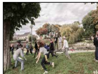
Journée Cabaret en 2017