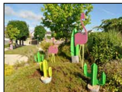
L'Etang en 2017