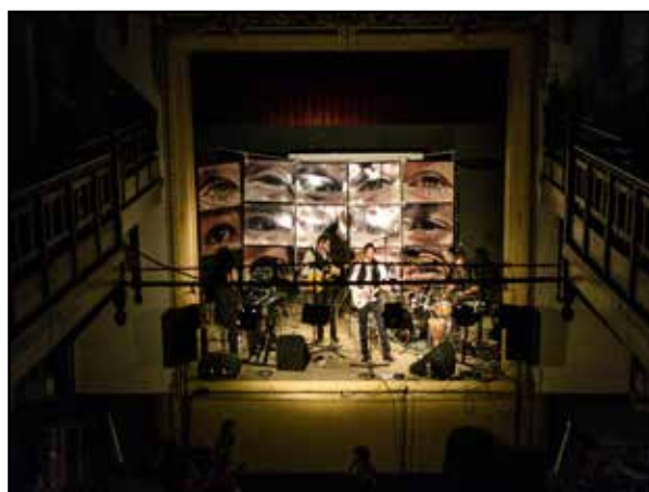
Au Foin De La Lune en 2017