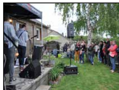
Musique au Jardin #2 : 12 et 14 mai 2017