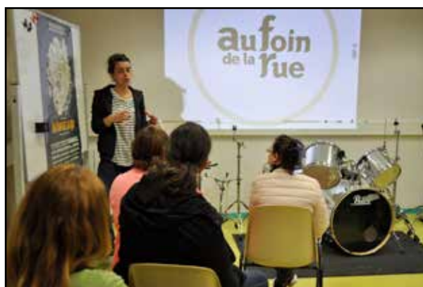
Visite - Présentation de l'association Droit de Cité de Fougères dans le cadre des «Parcours Diversité Culturelle» en 2017

Le projet d'animation de vie sociale locale de l'association Au Foin De La Rue souhaite s'inscrire dans un enchaînement d'actions s'appuyant sur la culture pour créer un fil conducteur cohérent et pérenne qui prend en compte les spécificités des partenaires et des publics dans leur grande diversité. Sur un territoire à dominante rurale, l'association cherche à mettre en place un parcours d'actions nouvelles et concertées ouvertes à tous.