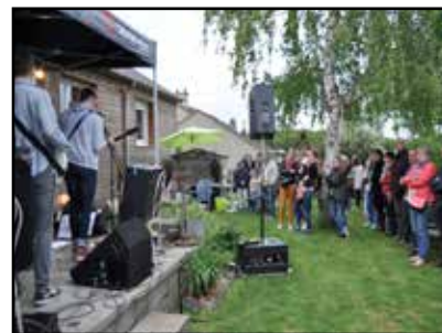
Musique au Jardin #2 : 12 et 14 mai 2017