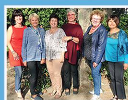
AU FIL DU CONTE