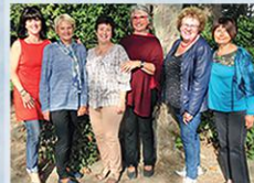
Au fil du conte