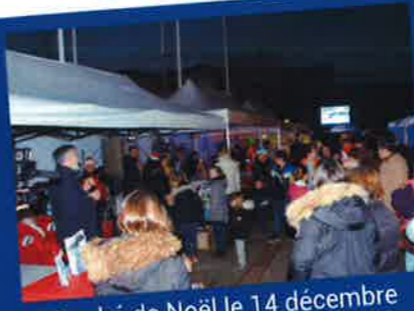
Marché de Noël le 14 décembre