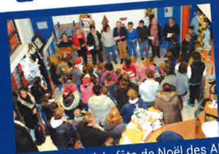
L'atelier Chant à la fête de Noël des APS le 15 décembre