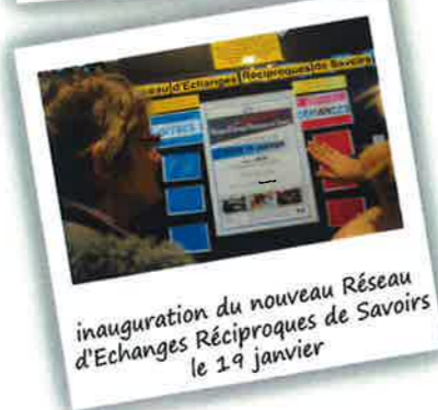
inauguration du nouveau Réseau d'Echanges Réciproques de Savoirs le 19 janvier