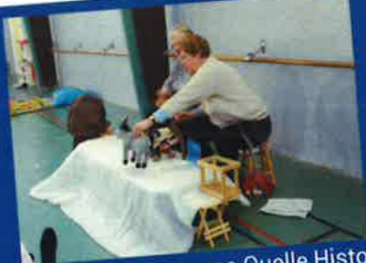
Animation du groupe Quelle Histoire ?! activités du RAM du 13 janvier

Bulletin de la vie Associative d'AGIES - n° 33 - février 2017