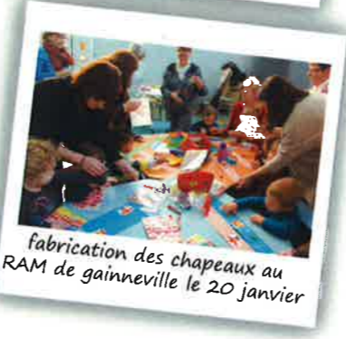
fabrication des chapeaux au RAM de gainneville le 20 janvier